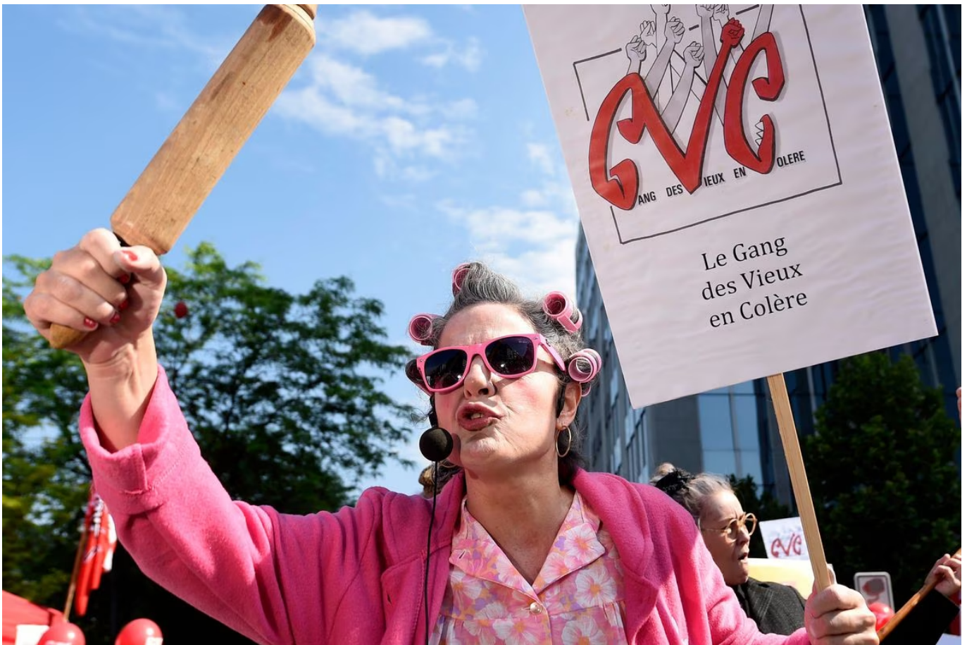
Le Gang des vieux en colère dit "non" à l'introduction de la peine accessoire d'interdiction de manifester.

Lisez l'actualité de qualité avec La Libre en profitant de 1 mois à 1€ seulement !